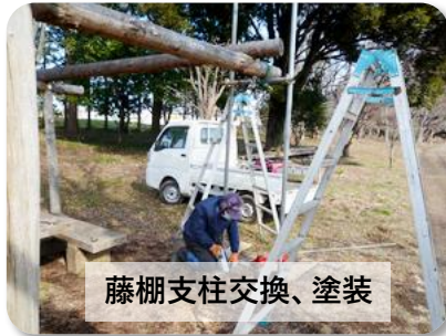
藤棚支柱交換、塗装