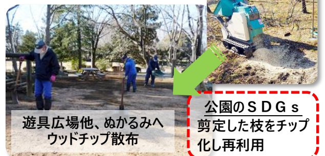
遊具広場他、ぬかるみへ ウッドチップ散布

■春から晩秋にかけて、公園管理業務のほとんどは、除草作業や芝刈り、花桃やハスの管理に落葉回収など、自然が相手の作業になります。冬になると草花も無くなるため、特に作業がないのでは？と思われる方もいるかもしれませんが、この時期には集中的に、公園整備の様々な作業を行っています。そこで今回は、2月に行った作業の一部をご紹介します。