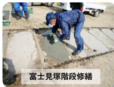
富士見塚階段修繕

■春から晩秋にかけて、公園管理業務のほとんどは、除草作業や芝刈り、花桃やハスの管理に落葉回収など、自然が相手の作業になります。冬になると草花も無くなるため、特に作業がないのでは？と思われる方もいるかもしれませんが、この時期には集中的に、公園整備の様々な作業を行っています。そこで今回は、2月に行った作業の一部をご紹介します。