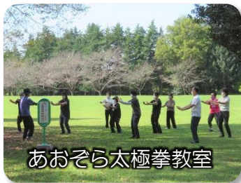
あおぞら太極拳教室

コロナウイルス感染拡大防止のため延期になっていたあおぞら教室(太極拳・ヨガ)が10月から始まりました。秋の青空の下、外での運動は気持ちがいいですね。