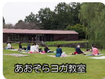
あおぞらヨガ教室