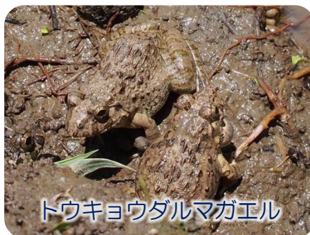
トウキョウダルマガエル

田んぼの生き物たちは、人の手が入らないと生きていけません。このような自然を、二次的自然といいます。長い時間をかけて人が自然と寄り添いながら作り上げた自然環境がホッツケ田には残されています。ヤゴやタニシはもちろん、都市部ではほとんど見るのできなくなったカエルも確認できました。