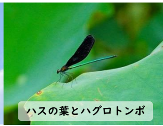
ハスの葉とハグロトンボ

(一財)古河市地域振興公社 古河公方公園(古河総合公園) 茨城県古河市鴻巣399-1 電話0280-47-1129