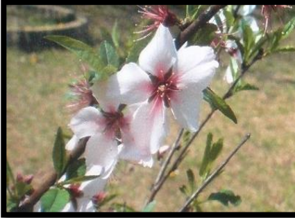
左5: アーモンド(徳源院付近)