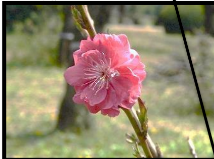
中4: 寒緋(徳源院付近)