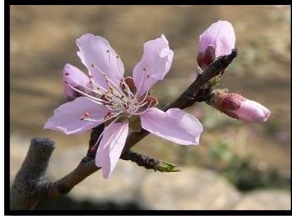
中5: 天津(徳源院付近)