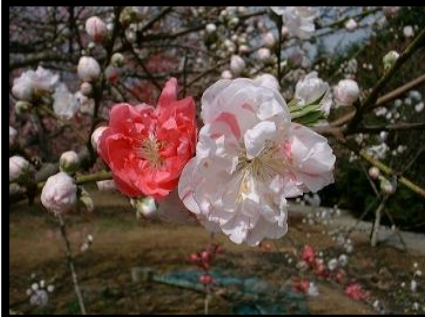
左4: 源平(4月に咲く花桃)