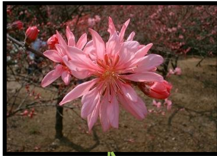
中1: 菊桃(4月中旬に咲きます)