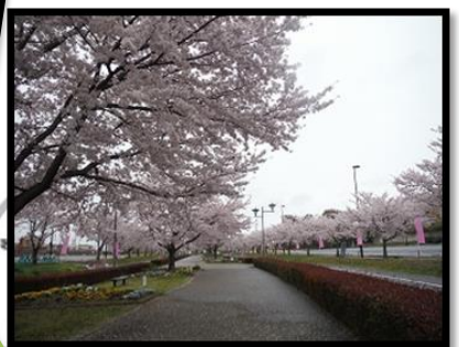
右2: ソメイヨシノ(染井吉野)