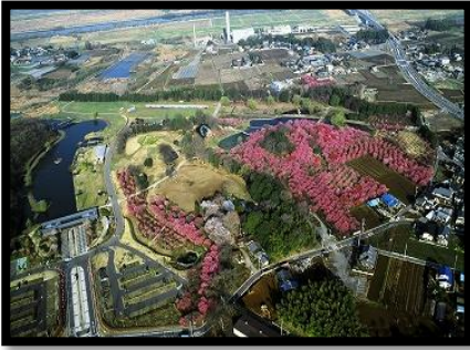
左1: 上空からみた桃林