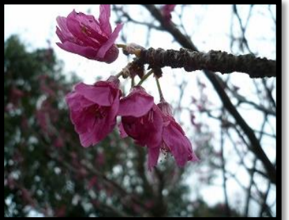
右4: カンヒザクラ(寒緋桜)