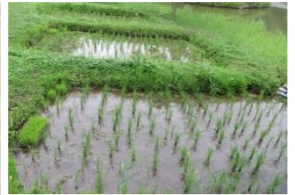
▲植えたばかりはこんな苗でした