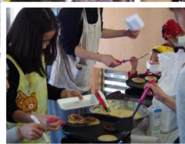
焼き当番も楽しいね▲