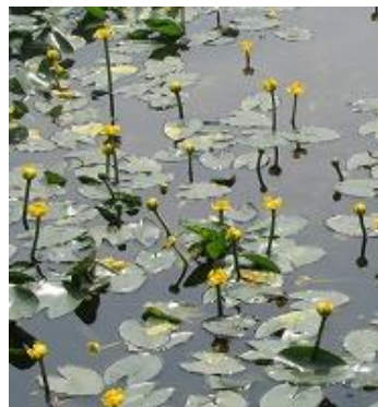
蓮池では → コオホネ[スイレン科] が咲き始めました。