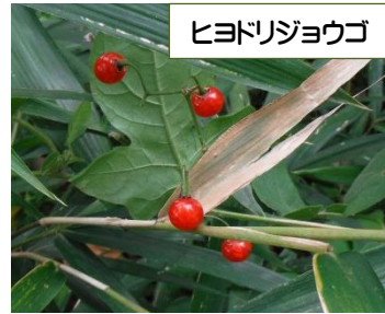
ヒヨドリジョウゴ