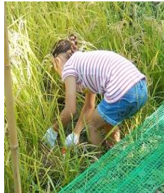
鎌で稲刈り、小さい子はハサミで。