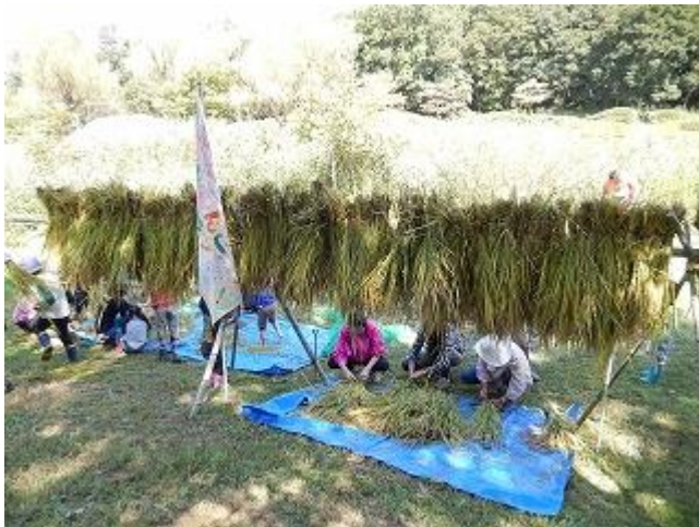
稲を束ねてシュロ縄で縛ったら稲束(ハンデン)に掛けます。このあと約2～3週間天日干しにし、その後脱穀します。