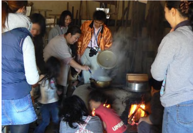
木を燃やし、火の力で米を炊く、これがなんとも魅力的。

4月末に種まき、5/27 田おこし、6/3 田植え、9/30 稲刈り、10/21 脱穀・・・ようやくこの日を迎えました。