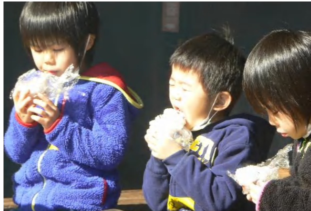
白いご飯だけでも、十分いけます。

★今年も、教育委員会のご理解ご協力により、文化財である古民家を使わせていただきました。ありがとうございました。