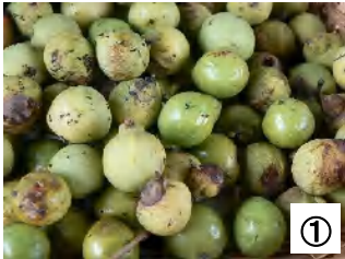
① 「ムクロジ」という木の実は、8月終わり頃から実を落とし始めます。