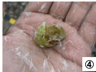
④ 皮を水にぬらしてこすると、みるみる泡だってきます。意外とクリーミー。