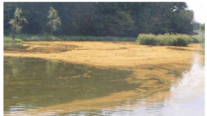
今年、御所沼では淡水の赤潮らしき状況が発生しています。また例年見られるヒシの繁茂がありませんでした。

また、冬には、水を1m程抜いて、浅瀬を干しあげたり、その後は地下水を注入して、水の交換を行っています。今年も1月に実施する予定です。