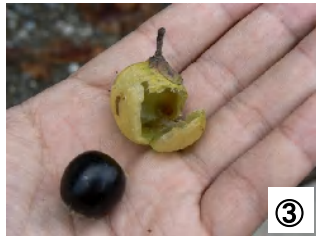
③ 種は昔から羽根突きの羽根に使われています。今回染しむのは皮のほうです。