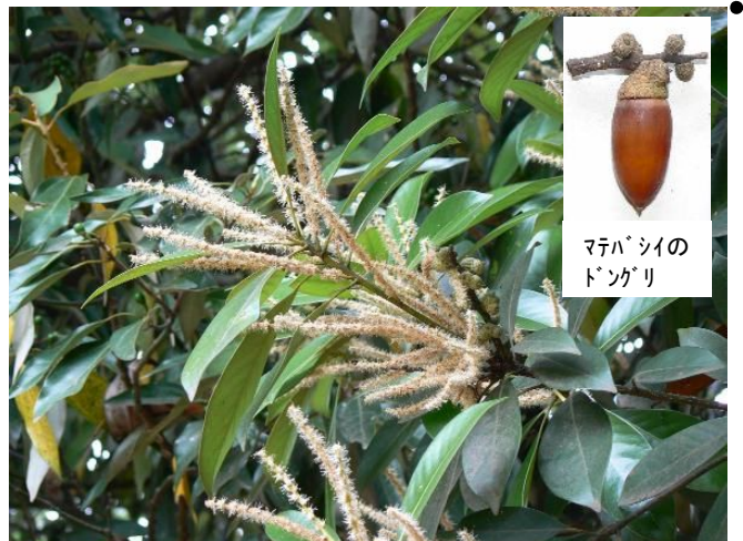
マテバシイの どんぐり

園内に2本植栽されている。花は生臭い独特の臭いがする。どんぐりは大ききさ2~3cm程で2年かけて実る。渋みが少ないため、そのまま炒って食用となる。