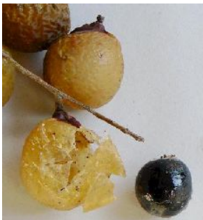
実の全形(上) 果皮(左) 取り出した種(右):種は羽根突きの玉になる。

毎年秋になると、市内の小学校が生活科の授業に訪れます。その時、ご紹介して、子供たちに大人気なのがムクロジの実です。