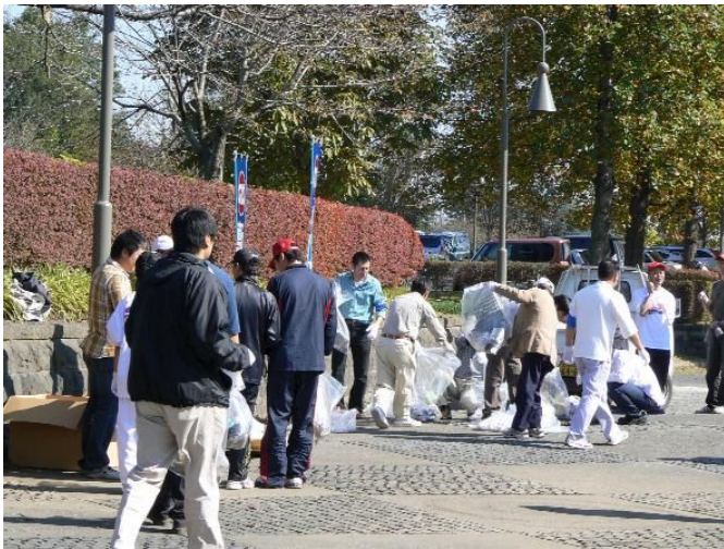
毎年、よかんべまつり直前に、園内隅々までゴミ清掃してください、大変助かっています。