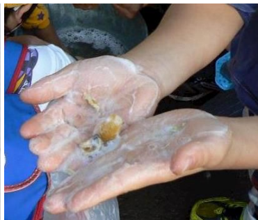
果皮を水でぬらしてこすると...ブクブク。昔は、石鹸の代わりに使われていたそうです。