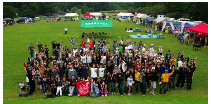
参加者全員での集合写真。バイクだけでなく、お店や音楽演奏も盛り上がりました。

今年で3回目を迎えるグリーンピースイベント。今回もバイクを愛する人たちが大勢集結しました。