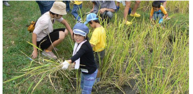
参加者の声「今年はなかなかの出来ばえです」「来年、また種にできるくらいは十分あるね」

待望の稲刈りの日がやってきました。今年は初の試みとして、みんなで種もみから発芽させて育てた稲を植えました。