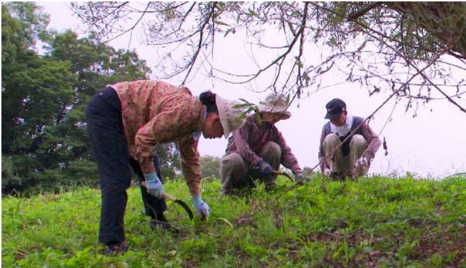
「数はだいぶ減ったけど、9月に除草した場所にまた新たな芽を発見！やはりしつこく出ていました」