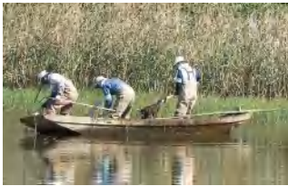
10月中旬から藻狩りと一緒に収穫。