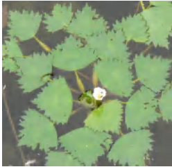
8月には白い花を咲かせた。