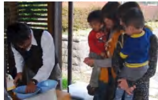
茹でたヒシの実の試食コーナー。