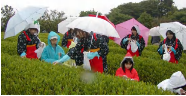
参加は、茶つみ100名ほど、茶会300名ほど。古河一高、 匠短期大学の学生さんらが、茶娘に扮して茶摘みの指導。