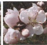
寿星桃 (鈴なりに咲く)