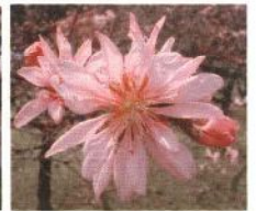
菊桃 (花卉が菊のよう)