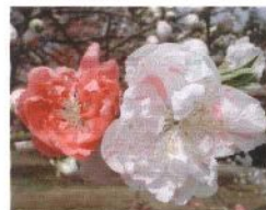
源平 (紅白咲き分け)

※源平、菊桃とも見頃は開花より5日後ほどから ※寿星桃(ジュゼイウ)の開花状況は源平とほぼ同じ