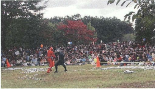
ちびっ子に大人気のデカレンジャーショー。芝生広場がぬかるんでいるため、中山台で開催。観客に、ぐるり360度囲まれて、会場に熱気があった。

一日目は雨天でしたが、二日目は雨が上がり、ピーク時には、足の踏み場もないほどの盛況ぶり。