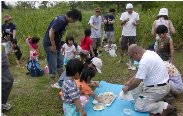
お昼には、買った赤米をおにぎりにして食べた。「秋には、ここで収穫したものを食べたいね。」「生き物のことも考えて、無農薬で育てましょう。」9月下旬に稲刈りの予定。