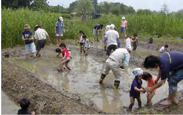
田植えの前に、ドジョウ1kgを放して、つかみどり。ヒンヤリ、ヌルヌル、どろって気持ちいいネ。

かつて、御所沼のほとりでは、水辺に細々と稲が育てられ、それをホツケ田と呼んでいた。今回は、28名のみなさんと一緒に、遊び心をおりませながら、ホツケ田の景観づくりに挑戦。5×3m程の小さな田んぼ3面を植えた。