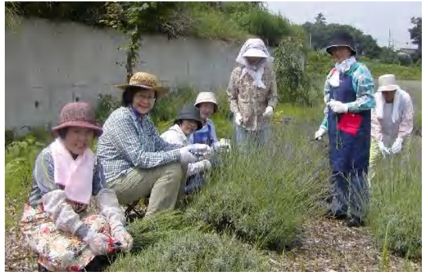
刈った穂は、管理棟で2週間ほど乾燥。来園者の方にプレゼントされたほか、今後、会員のみなさんの手によって、ステキなグッズとなって、市役所などで配布される予定。 主催/香り友の会