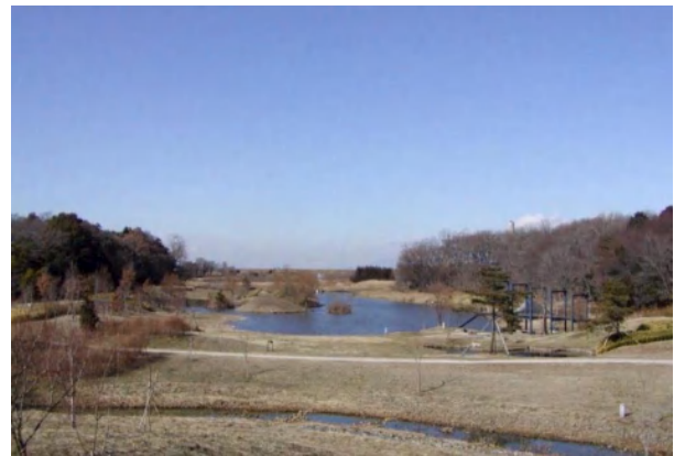
日和山から見る赤城山/築山の上からは、沼を通して、渡良瀬川の土手、その向こうに雪をかぶった赤城山が見える。この築山は御所沼を復元したときの残土を積み上げたもの。