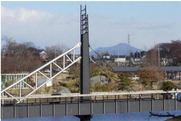
筑波見の丘から見る筑波山/丘の上から東を見ると天神橋の向こうに濃紺色の筑波山が見える。

遊ぶ、守る、描く、眺める・・・ アイデアは様々。 みなさんの関わり方次第で、 総合公園は、これからも、もっと、 楽しい、そして大切な場所に・・・