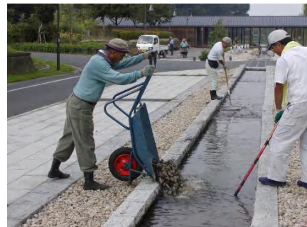
50mにわたり、10cm程の厚さで砂利を敷いた。

小石の表面に付いたバクテリアは、水の養分を食べます。水が、沢山の小石の間を流れることで、より多くの養分が分解されるという仕組みです。