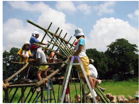
高い場所での骨組み作業は、子供たちに大人気。材料となった、シラカシや孟宗竹は、すべて園内調達。