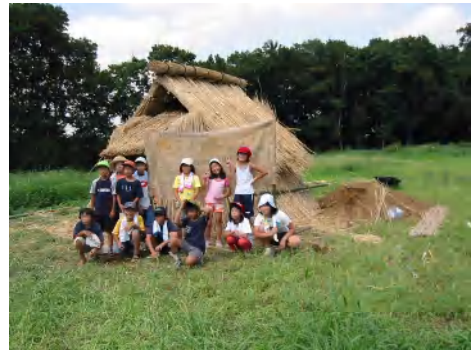
NHKで放映された他、RCC テレビ、四大新聞も取材に。子供たちも、ちょっと自慢気。