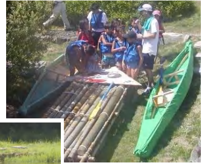
「こぎたい」との思いも叶った