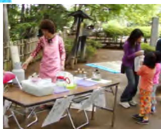
自慢のハーブティーでおもてなし！ (ハーブ友の会)