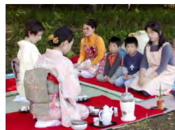
野点には、17席の参加がありました。ちびっ子は、ちょっと緊張！