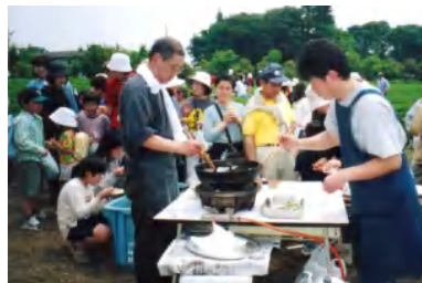
お茶の天ぷらコーナー 「お茶の天ぷらが食べたくて今年も参加しました」との声も。