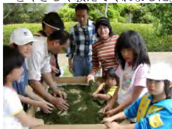
お茶の手もみコーナー 「手もみ初体験！あついで驚きました」 お昼には、みんなでもんだ茶をいただきました。