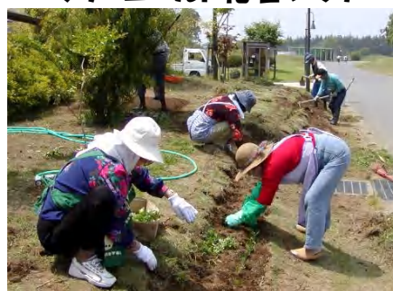
“まちをきれいに 人の心にやすらぎを”を合い言葉に会員の方々が、家で大切に育てた苗を植えました。7月には、斜面からこぼれ落ちるほどに、多くの花を咲かせます。 主催/古河くらしの会