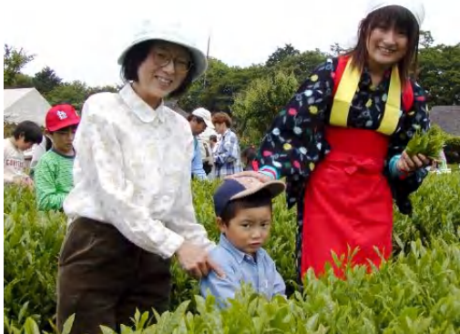
古河二高 JRC の皆さんは、茶娘姿で登場。茶つみの仕方をやさしく教えてくださいました。

雨天で一日延期でしたが、321名が参加。猿島茶(さしまちゃ)は、手ざわりやわらか、味わいさわやか。木陰では、赤い毛せんの上で野点。ちょっぴり風流な気分で、おしゃべりを楽しみました。