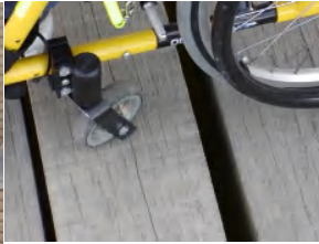
浄円坊の池に架かる橋では、板の隙間に車輪が落ちない工夫が必要。