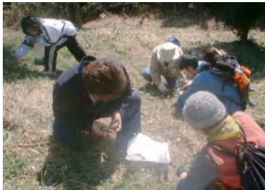
「斜面なので楽な姿勢でヨモギがつめます。ここをヨモギの丘と呼んだらどうでしょう」(日和山東斜面にて)