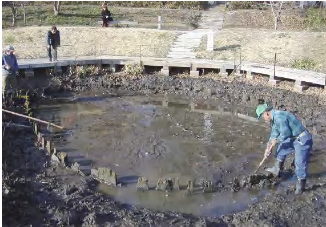
水を抜いた目洗い弁天池。7匹の鯉は御所沼へ引っ越し。かつて眼病の癒えた時には、お礼にウナギを放したそうです。

そんな中でも「虚空蔵菩薩さま側から今でも浸みだす湧水」の発見には心が洗われる想い。