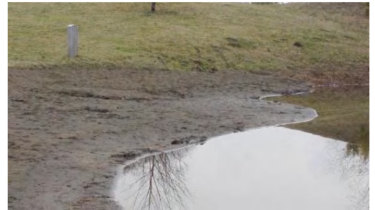
雨が砂を運び、水際の一部に砂州が現れた。雨の翌日には、水が湧き出す所も見られますよ。