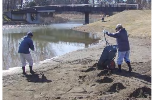
草の生えた表土10cm程を除去し、新しく砂を敷き直し。

草に覆われてしまったまくらが浜が、砂浜に戻りました。工事の終わった翌日には、早速、(チビッコの作品でしょうか?) 砂の山が築かれていました。