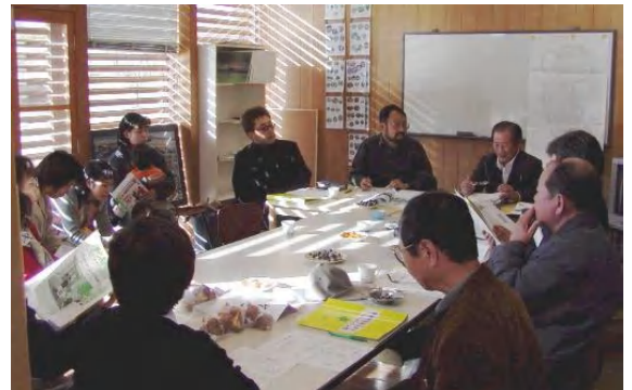
1歳～70歳代の老若男女が参加。古河っ子も、最近移り住んだ方も、それぞれの生活スタイルから、古河総合公園に寄せる思いを意見交換。

* (仮称)みどりと遊びの会は、毎月第二火曜日に開催予定。 興味のある方は、パークマスターまでお声掛け下さい。