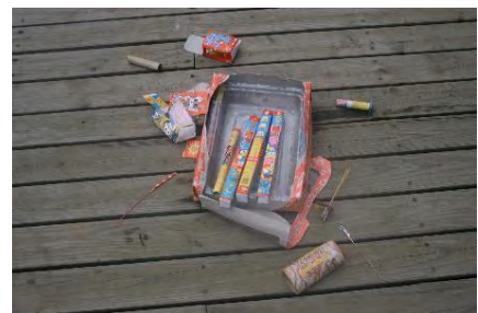
▲花火の後片付け、ご協力よろしくをお願いします。