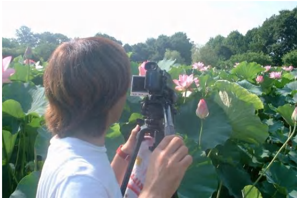
▲「放映時間は①9:20～9:25②14:20～14:25③19:20～19:25。私たちの努力の結晶、ぜひ、ご覧下さい！」RCC野崎さん

ハスの一つの花の開花期間は4日間。その経過をビデオにおさめました。撮影期間は7月23～26日。ここで、撮影よもやま話を少々。