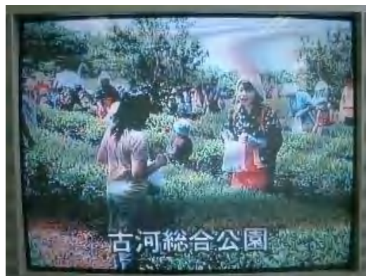
▲「地域社会の再生」の事例として「お茶つみ体験教室（開催／5月12日）」を紹介。