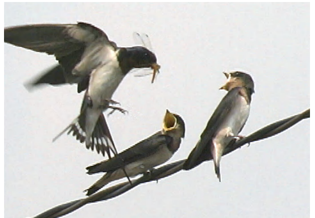
▲ツバメ。御所沼の水面ギリギリを巧みに飛びながら、トンボなどをとる姿をみかけます。

かつて近くのKストアに数個の巣があった。しかし改築してからなぜか営巣しない。そのころ、今は大駐車場になってしまった所に生活排水の流れがあり、その辺りをツバメが飛び交っていた。両者は関係があるのだろうか？野鳥には分からないことが多い。