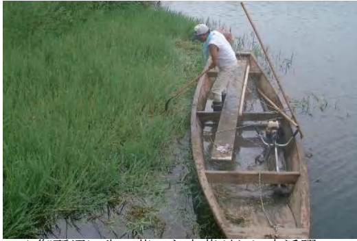
▲御所沼に生い茂った水草刈りに大活躍。

和舟を使ってみたい、学校の先生、子供会、市民団体の方々、相談にのります。パークマスターまで、お気軽に、お声をおかけ下さい。