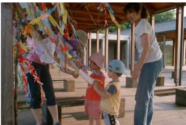
▲笹は、管理棟とジェラテリアに飾って、短冊と筆記具をご用意、一般のお客さんからも、いっぱいお願い事をいただきました。