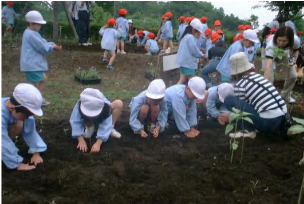
▲女満別ひまわり、ミニひまわり、大輪ひまわり、八重咲きひまわりを、各約100本ずつ、そーっと、大切に植えました。