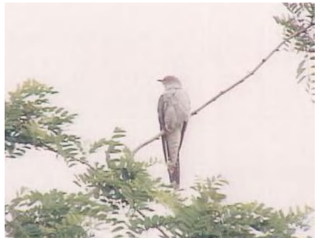
▲カッコウ。胸と腹は、白地に細い黒帯模様。ハトより大きくて尾が長いので、肉眼でもよくわかる。

オオヨシキリなどの巣に卵を産み付け「自分では子育てをしない」という習性がある。以前、公園の南側の高い木に止まる姿を多くみかけたが、オオヨシキリも減っているようなのでどうであろうか。