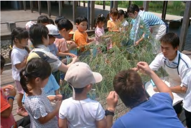
▲6月18日の七夕飾りでは、公園を見学に来ていた大学生のおにいさん、おねいさん9名も参加。