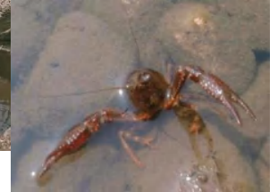
▲みんな待ってるガニ！