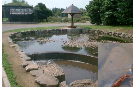
▲御所沼の水をポンプでくみ上げて循環させています。