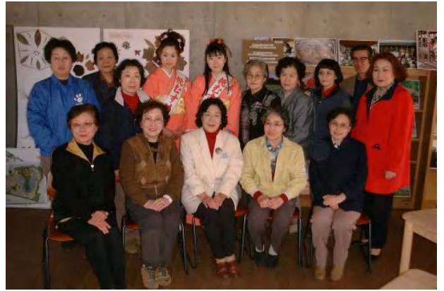
▲くらしの会出席のみなさん、桃娘さんと一緒に記念撮影

「図書室や講座室をもっと活用していきましょう。」「ボランティアの力で管理棟を運営できないか?」など、熱い意見が交わされました。