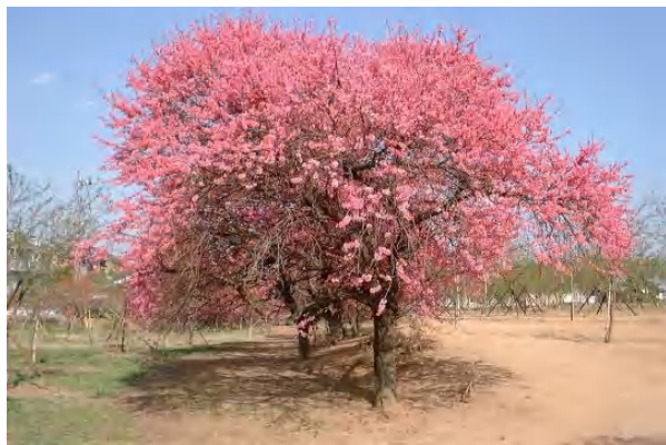
▲隠れた名所 十念寺原の菊桃並木

矢口に始まり、寿星桃、源平と続いた花桃の饗宴、大取を飾るのは菊桃。キク花状の細い花卉が特徴で、晩春の青空を真紅に染めます。あでやかさは、矢口に負けません！