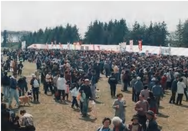
▲来園者ピーク時の芝生広場(4月1日) 今年の矢口の見頃は、3/28～4/3頃でした。