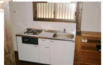
▲室内には、土間(大テーブル有り)、6畳座敷、キッチン(流し台、ガスレンジ2台)、シャワー、トイレが有ります。