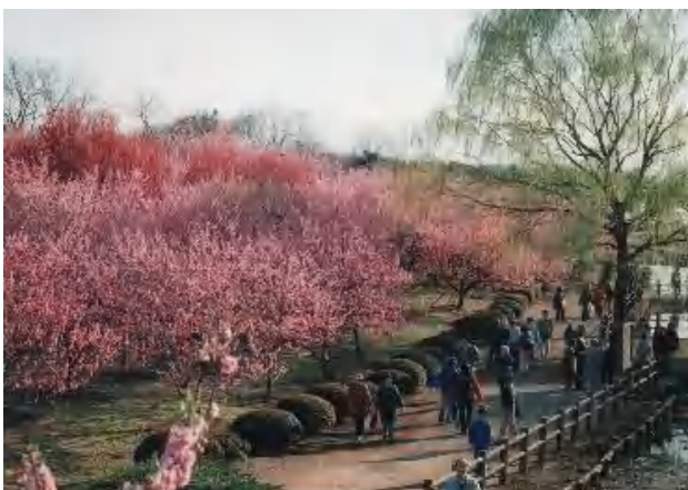
▲今年の花桃は極上の出来ばえ。花数多し！ 色よし！花持ちよし！