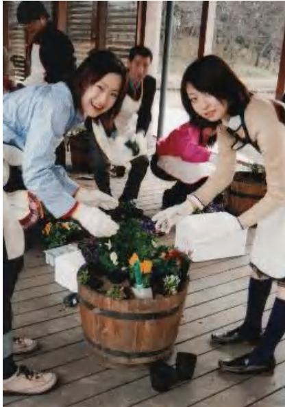
▲桃むすめさんによるお出迎え花桶づくり (3月6日 桃娘研修の時に)