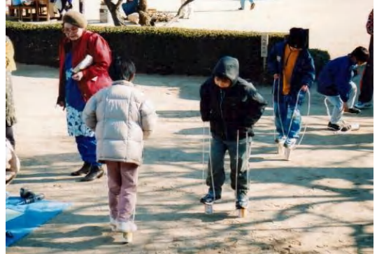
▲「缶馬」空き缶にヒモを通してカバコボ歩く