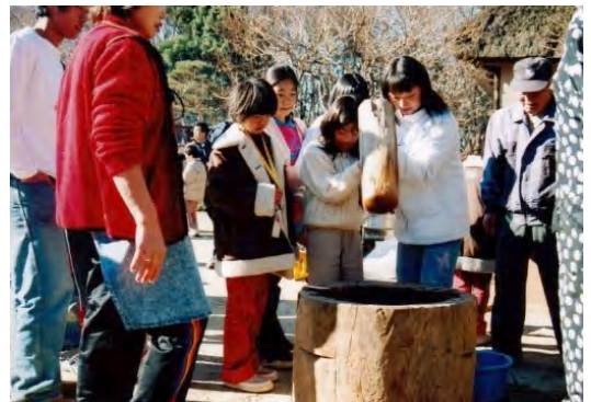
▲重たい杵をドッコラショ