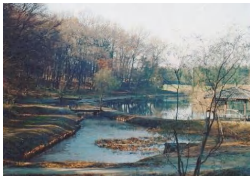
▲毎年、一番最初に、そして厚い氷が張る場所