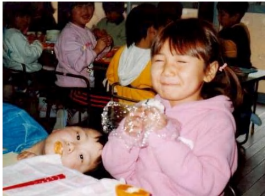
▲自分たちで植えたお米の味は、「おいしい〜！」