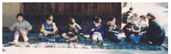
▲お餅は「きなこ」「あんこ」「大根おろし」