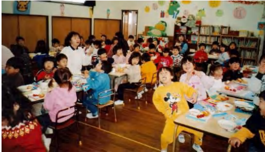
▲焚いたご飯を、ラップに包んで、自分で握りました

収穫できた米7kgのうち、5kgを使って、第四保育所で「おむすびパーティー」を開催。