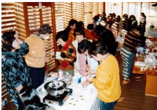
▲ドライフラワーのラベンダーを湯煎して、色や香りを抽出