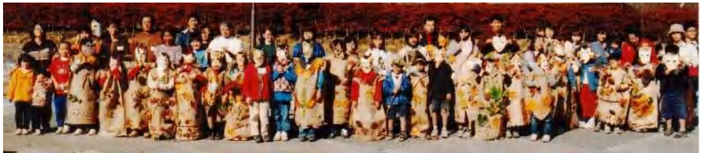
▲お面・ドレスで着飾って、秋のファッションショー！