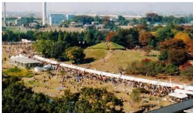
▲晴天に恵まれ両日も大盛況