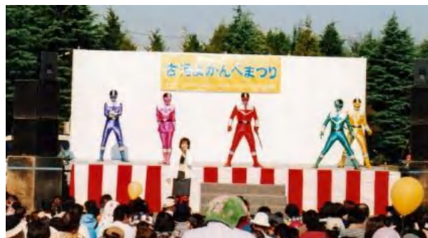
▲ちびっこに大人気、タイムレンジャーショー