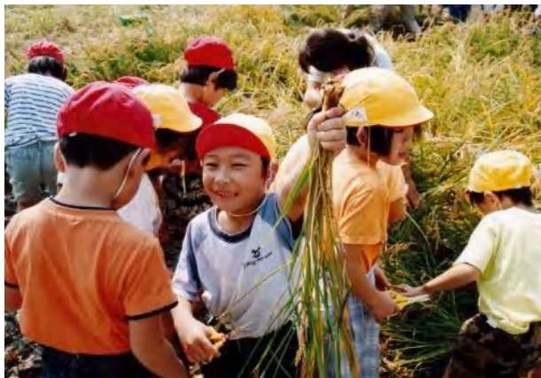
▲ちびっこ約30名、大奮闘の稲刈り!