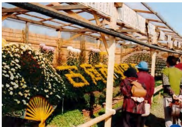
▲今年は、約31000人が訪れました。