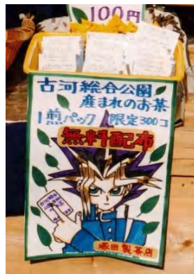
▲総合公園で収穫されたお茶を無料配布(協力:古河茶業組合)。平成13年度には、楽しいお茶畑イベントを検討中。