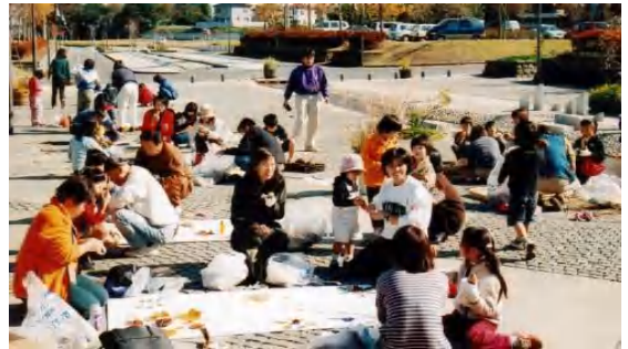
▲雪葉図説づくり：木の実、葉を使って六角形の結晶づくり

「巨大お面」は公園管理棟の展示室に、「雪葉図説」は1月より古河歴史博物館に展示の予定です。